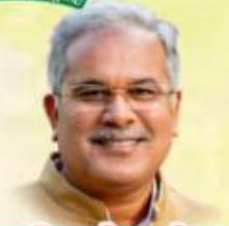
माननीय भूपेश बघेल जी मुख्यमंत्री, छत्तीसगढ़ शासन