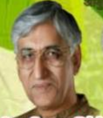
माननीय टी.एस. सिंहदेव जी स्वास्थ्य मंत्री, छत्तीसगढ़ शासन